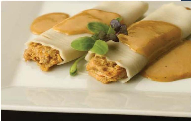
Relleno de Nécora