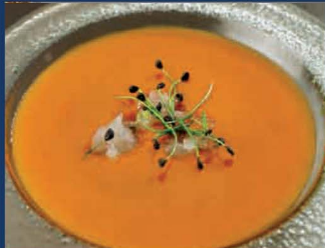
Fumet de Marisco