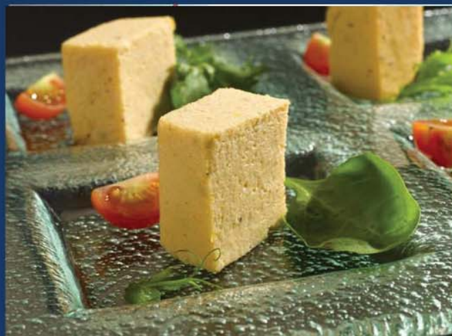
Pastel de Centollo